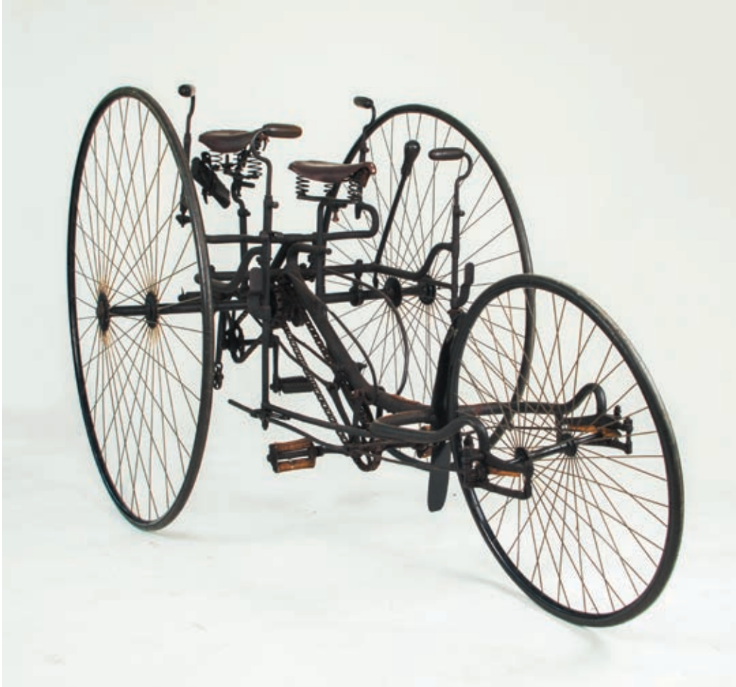
◀ Tricycle tandem Quadrant . Musée Vélo Moto de Domazan.