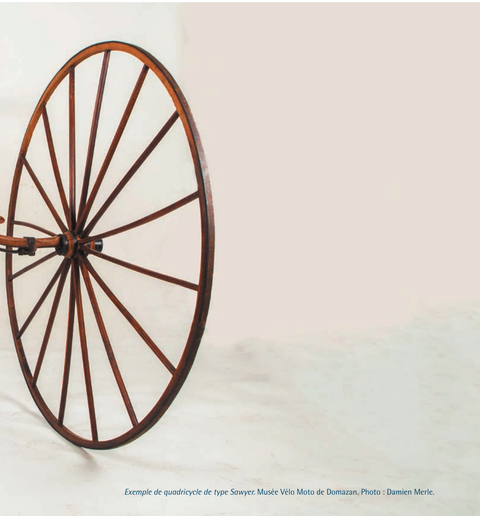
Exemple de quadricycle de type Sawyer. Musée Vélo Moto de Domazan.