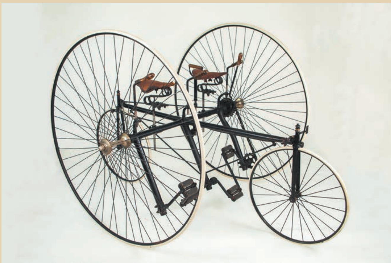
Exemple de quadricycle sociable. Attribué à Haynes & Jefferys. Musée Vélo Moto de Domazan.