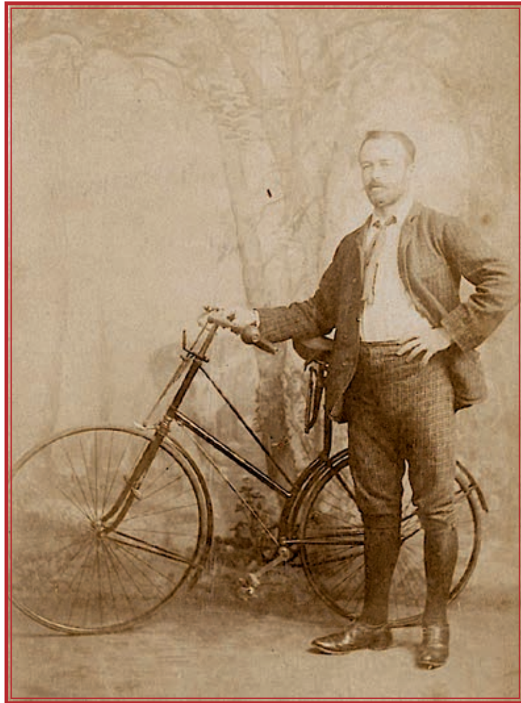
◀ Bicyclette Quadrant. Photo non datée. Droits réservés.