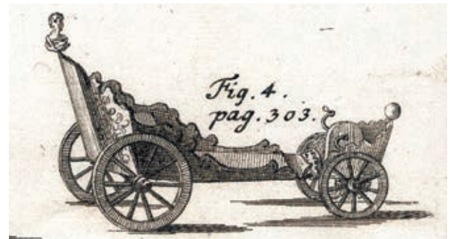
Véhicule dû à Stephan Farfters (orthographié Faffler également). 1730.