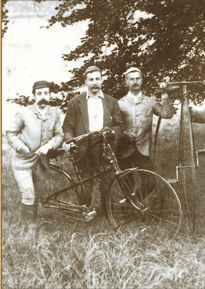
◀ Whippet. Scène de campagne.